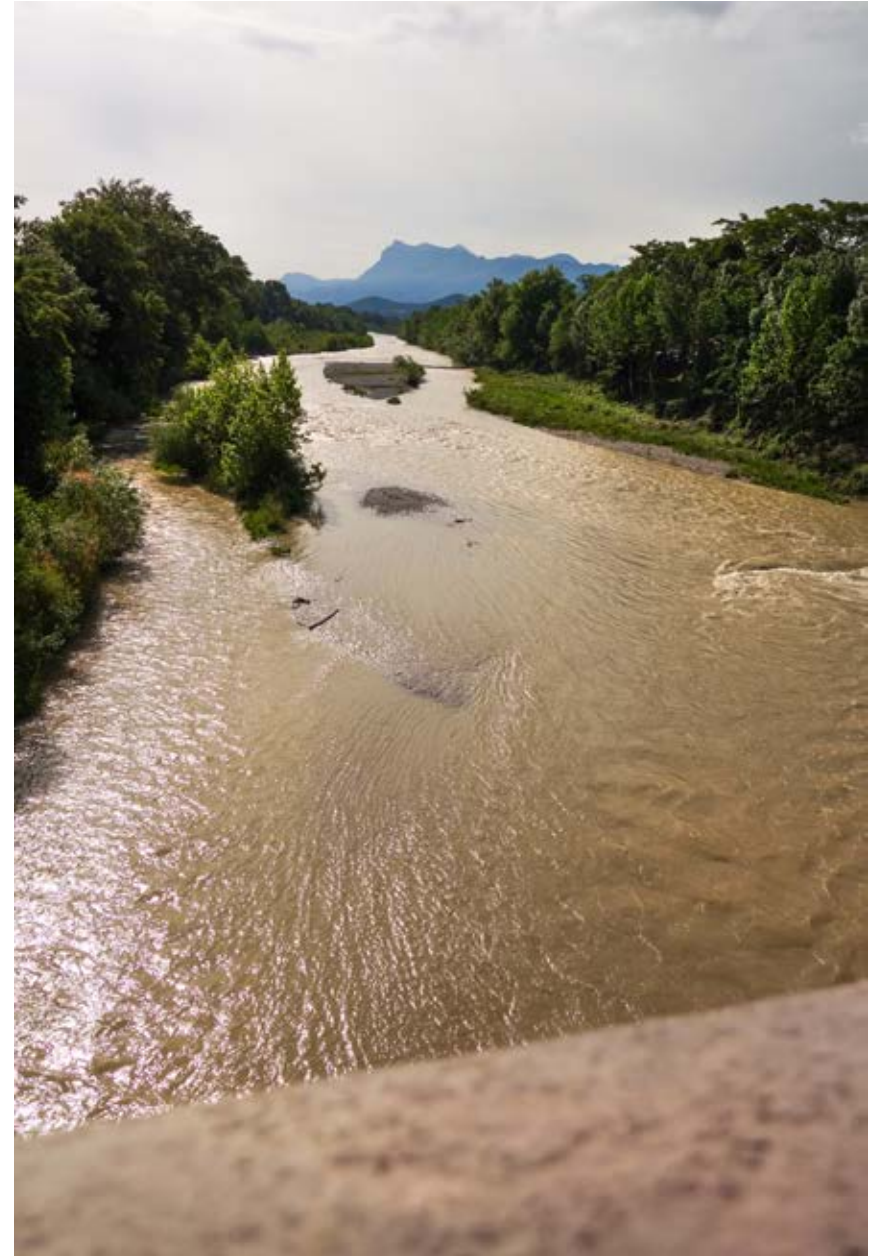
LA ROUTE VERS L'INFINI