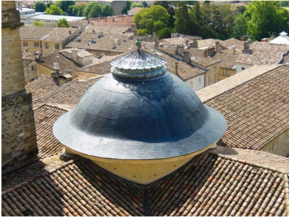
BALADE SUR LES TOITS