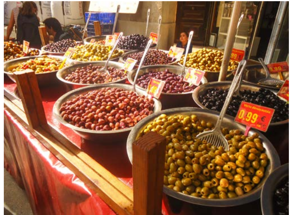
MA PREMIERE PIZZA