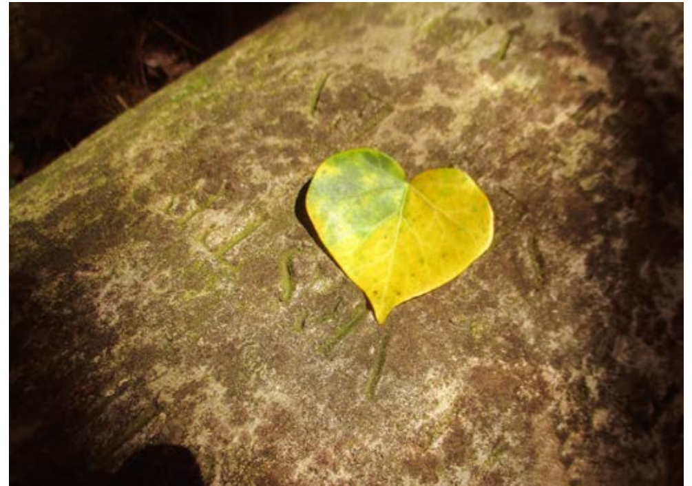
CŒUR DE PIERRE