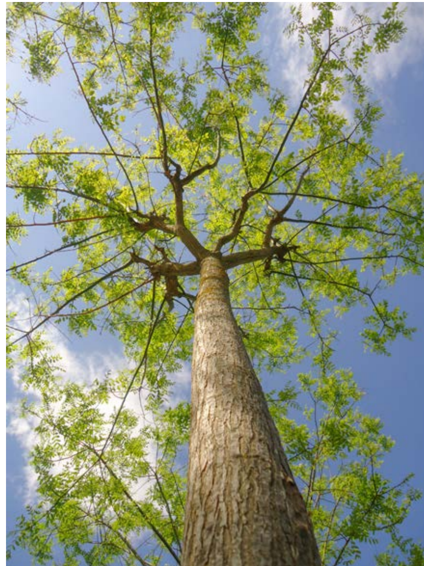
LA MAIN VERTE