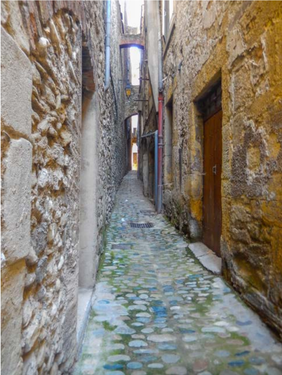
LE BOUT DU MONDE