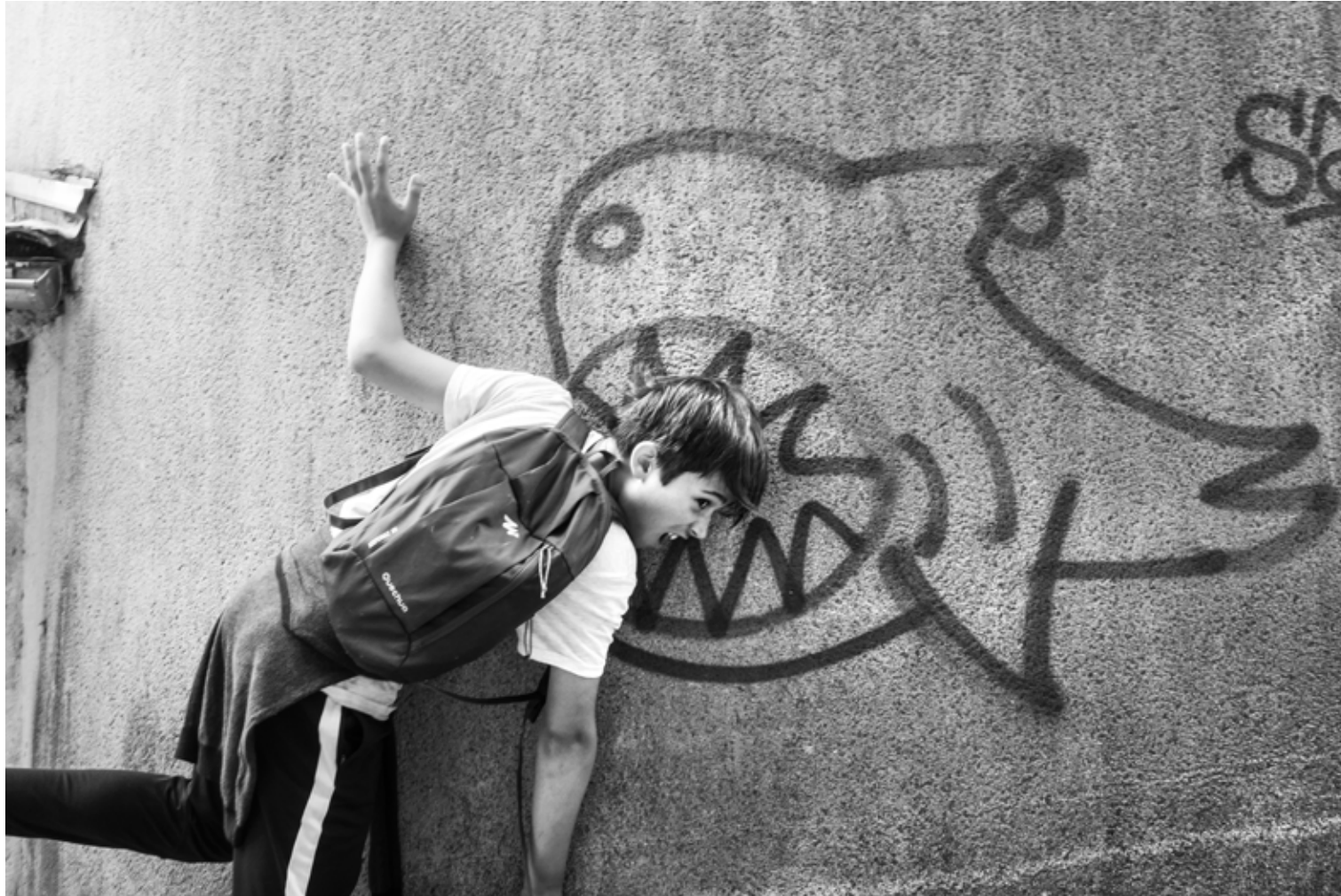
LES DENTS DU MUR