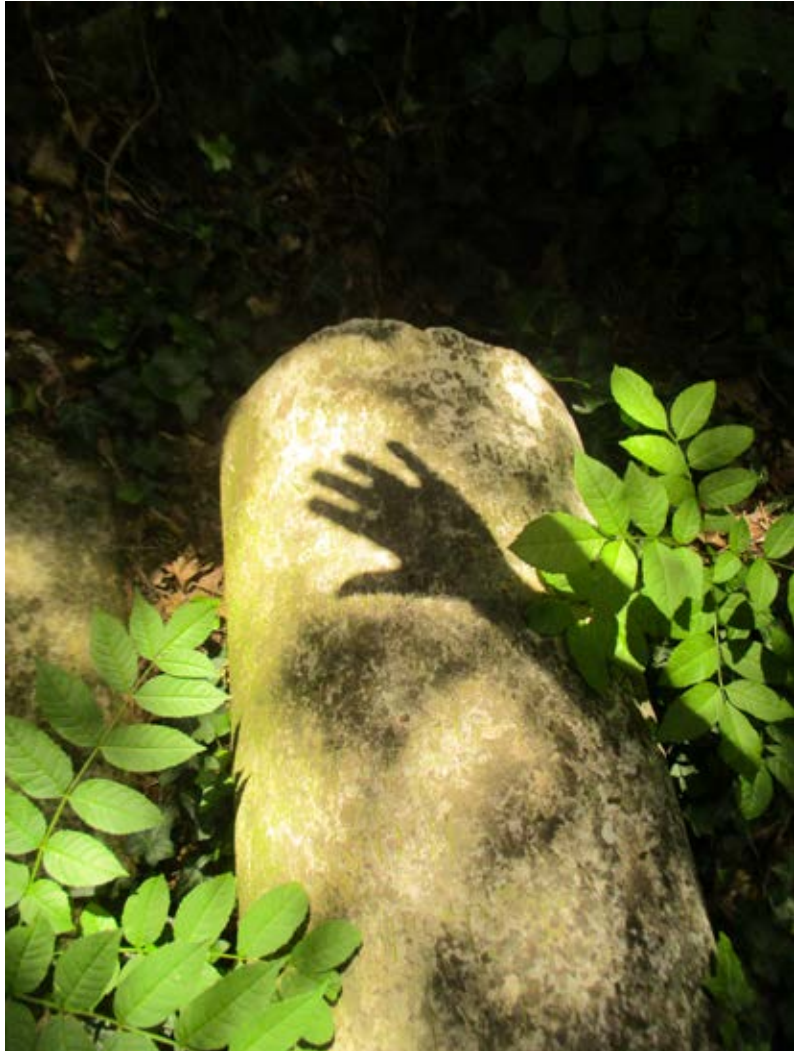
LA VIE ET LA MORT