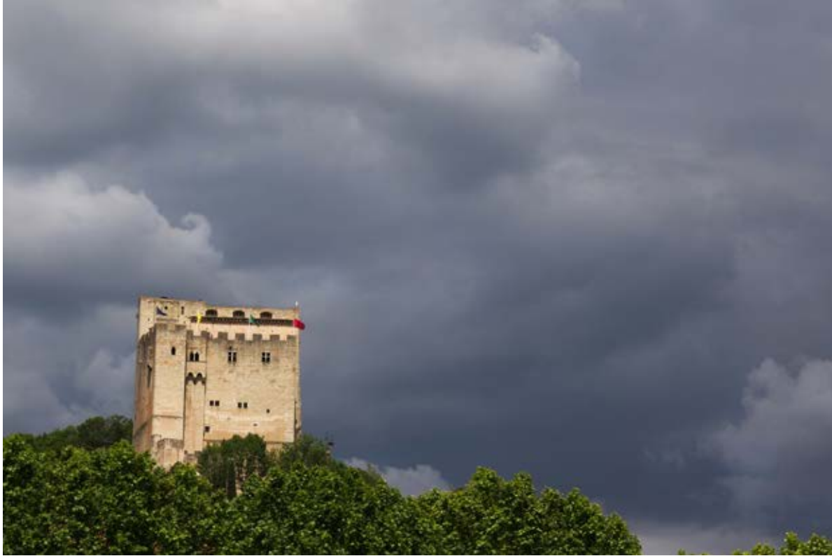
UN PHARE DANS LA NUIT