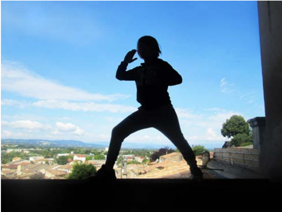
LE NINJA DANS L'OMBRE