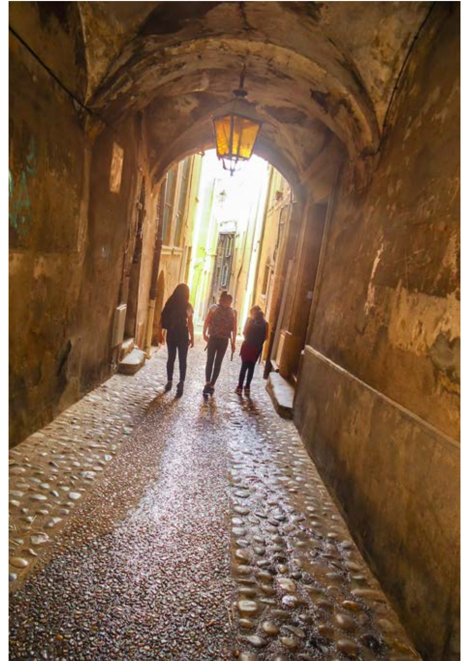
LES TROIS FILLES DE L'OMBRE