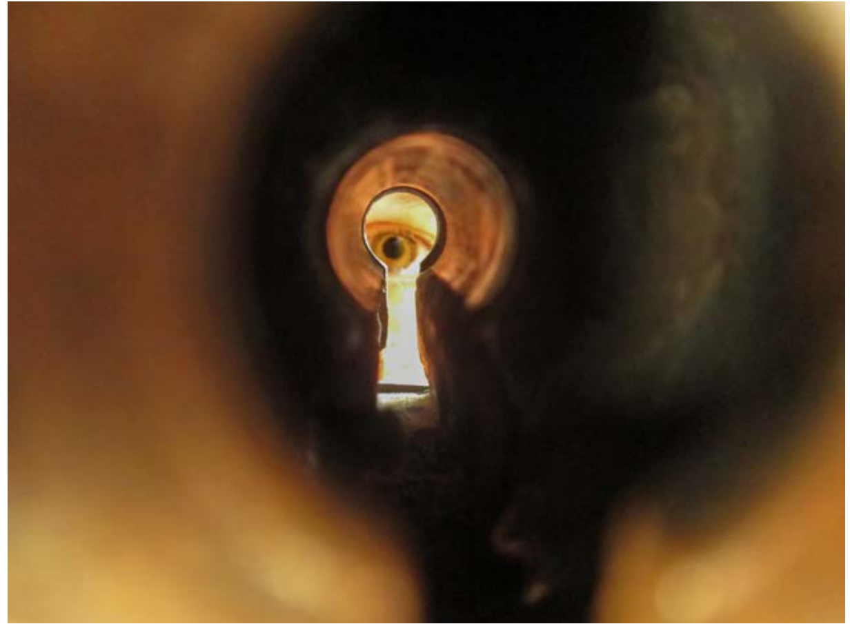
REGARD SUR LE MONDE