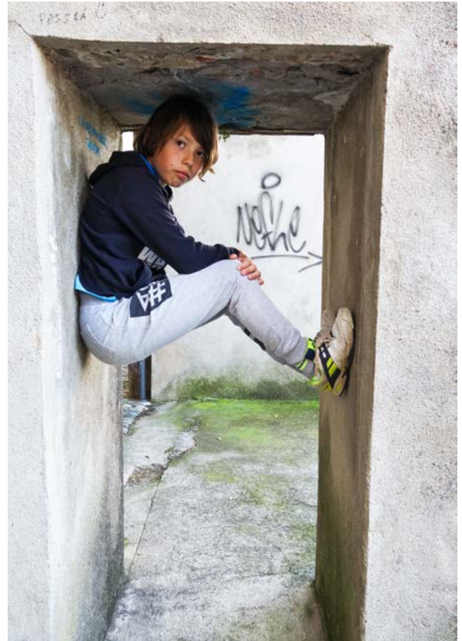
LA PORTE URBAINE