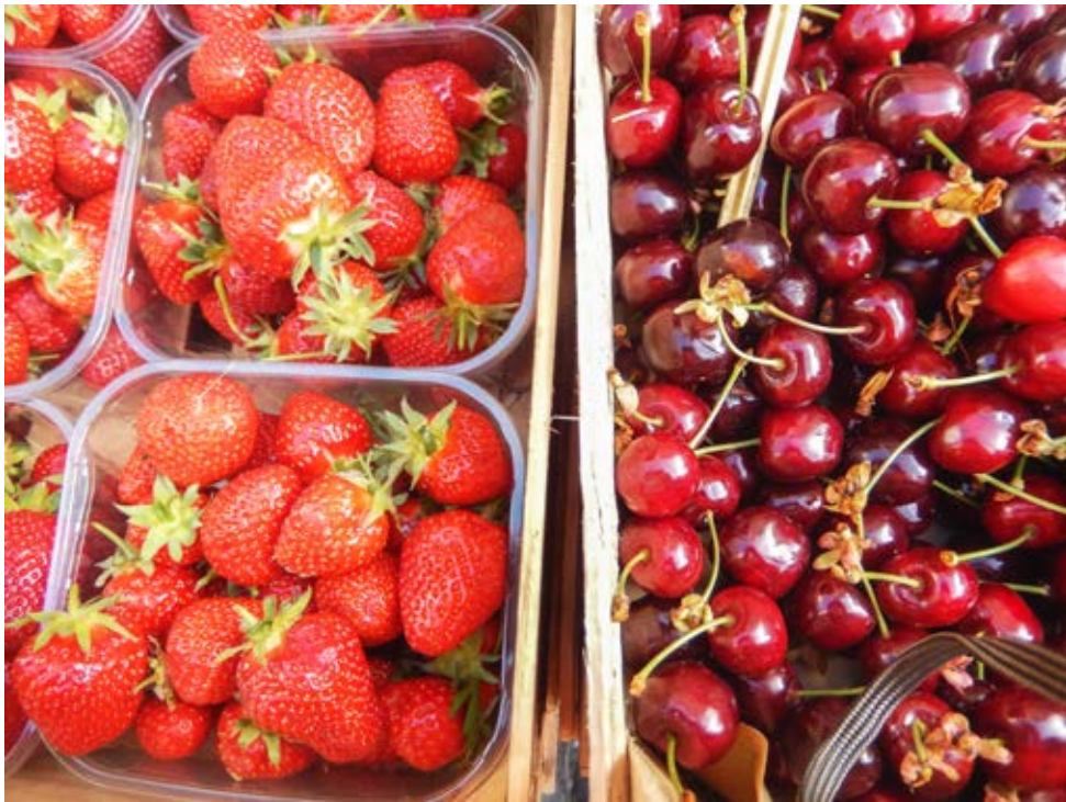
LA FAIM DES HOMMES