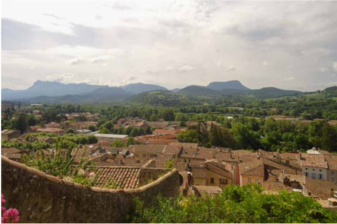
LA VILLE DANS LA NATURE