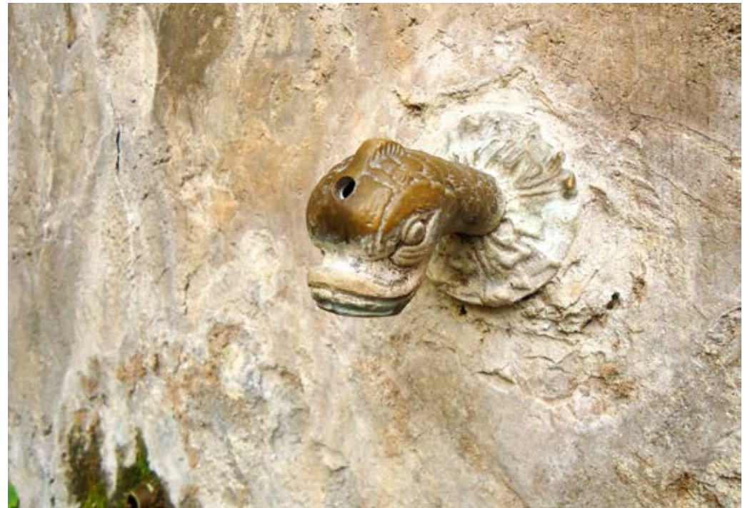
LE MONSTRE FONTAINE