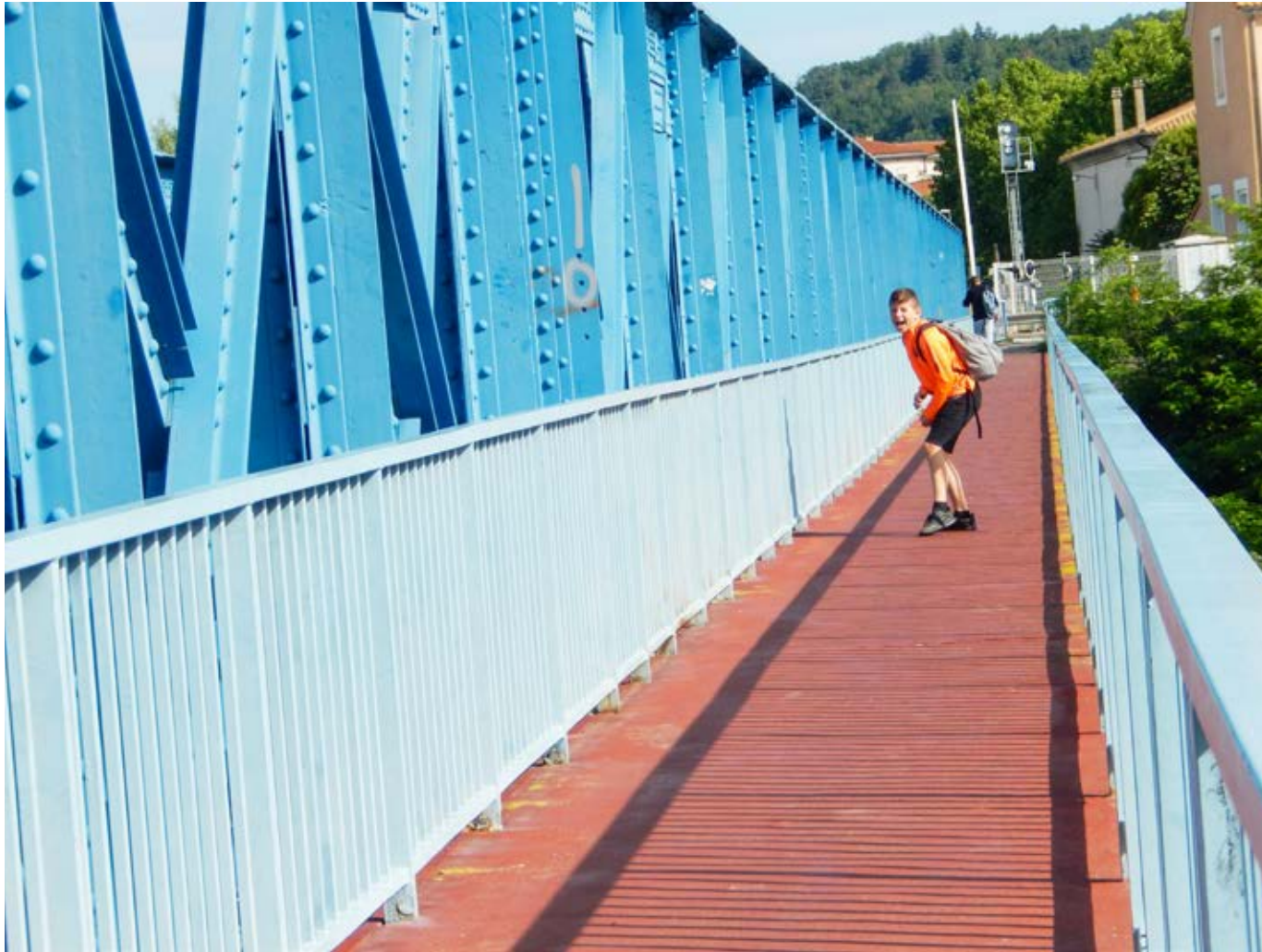
LE GARÇON SUR LE PONT