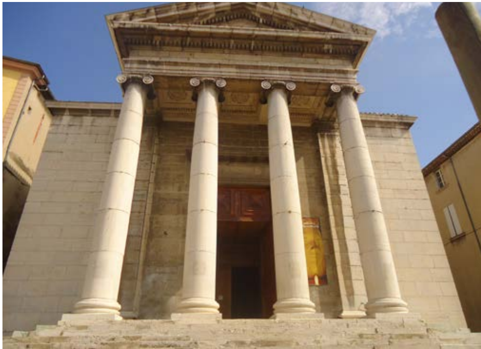
LES QUATRE PILIERS